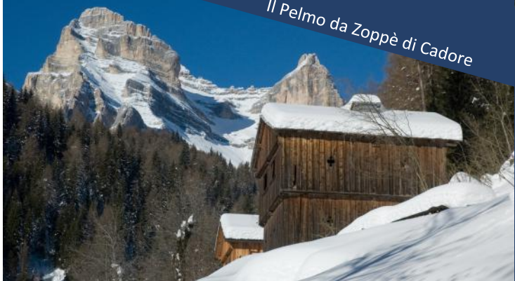
Il Pelmo da Zoppè di Cadore